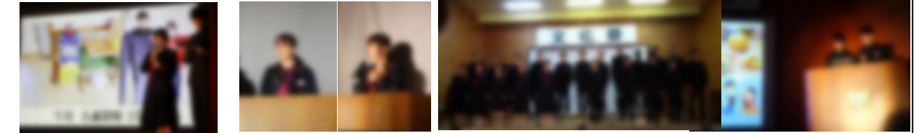
【羽島中学生徒会ニュース】 【英語弁論】 【全校合唱「正解」】 【職場体験学習発表】

参観していただいた保護者や地域の皆様からは、「全校合唱を聞いて涙がでました」、「堂々と発表できていた。」「ダンスや演技が上手だった。」などと声をかけていただき、生徒たちも喜んでいました。また、舞台発表の前後の時間に、展示作品を見ていただき、日頃の学習活動を感じていただくことができました。たくさんのご来場ありがとうございました。